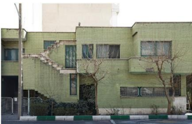
شکل ۸- ساختمان شاپان

ویلای وزرا و خانه تناولی (تصویر ۷) به عنوان نمونه‌هایی از ویلاهای ایرانی، سازمان‌دهی فضایی متفاوتی دارند. در این بناها، فضای تهی نه تنها در قالب حیاط‌های مرکزی، بلکه به صورت بازشوهای وسیع، تراس‌های نیمه‌باز و فضاهای سبز داخلی تعریف شده است. در ویلای وزرا، ترکیب فضای پر و خالی به گونه‌ای است که اجازه ورود نور طبیعی به بخش‌های داخلی را فراهم می‌کند و این فضاها به صورت سلسله‌مراتبی از ورودی تا فضاهای خصوصی داخلی سازمان‌دهی شده‌اند. خانه تناولی از لحاظ نحوه استفاده از فضای تهی، شباهت‌هایی با ویلای وزرا دارد، اما در آن، تأکید بیشتری بر فضاهای واسطه‌ای و ارتباط بصری میان داخل و خارج ساختمان دیده می‌شود.