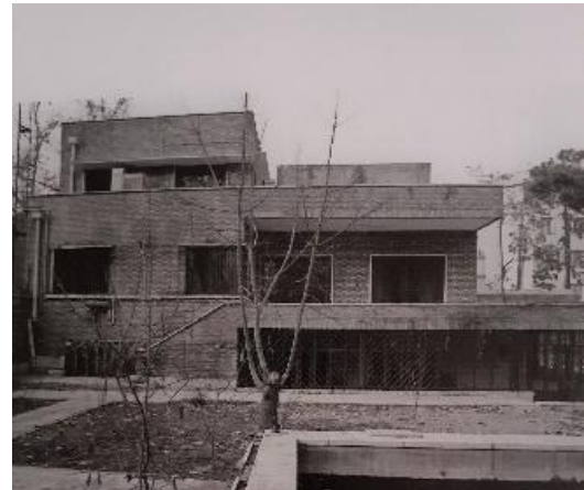
شکل ۳- خانه ابن سینا

خانه میردامادی (شکل ۴)، خانه لقمان الملک و خانه مشیرالدوله از جمله بناهایی هستند که در آن‌ها تغییراتی در نحوه استفاده از فضای تهی مشاهده می‌شود. این ساختمان‌ها با وجود حفظ برخی اصول سنتی، دارای فضاهای خالی غیرمتمرکزتر هستند. در این بناها، حیاط مرکزی به‌عنوان عنصر اصلی حضور دارد، اما فضاهای باز دیگری مانند گذرگاه‌ها، حیاط‌های جانبی و تراس‌های روباز نیز در نظر گرفته شده‌اند که باعث ایجاد تعامل بیشتر بین فضای پر و خالی شده است. در خانه مشیرالدوله، این رویکرد به شکل متفاوتی به کار رفته و فضاهای خالی نه تنها در قالب حیاط، بلکه در طراحی نما و تراس‌ها نیز نقش مهمی ایفا می‌کنند.