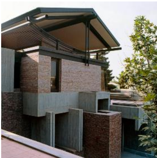
شکل ۱۰- ویلا عالیخانی

ویلای نمازی، ویلای زرتشت و خانه افشار (تصویر ۹)، سه نمونه از ساختمان‌هایی هستند که به دلیل مقیاس بزرگ‌تر و ماهیت طراحی باز خود، دارای تعامل بیشتری بین فضای پر و خالی هستند. در ویلای نمازی، فضای تهی نه تنها در قالب حیاط و تراس‌ها، بلکه به عنوان بخشی از ترکیب‌بندی اصلی نما و فرم ساختمان حضور دارد. در این ویلا، استفاده از فضاهای خالی میان دیوارها و بخش‌های مختلف، به پویایی بصری و عملکردی بنا کمک کرده است. در مقابل، ویلای زرتشت از فضای باز برای تعریف مسیرهای حرکتی و سازمان‌دهی فضایی استفاده کرده است و فضاهای خالی در آن، نقش واسطه‌ای بین فضای داخلی و محیط بیرونی دارند. خانه افشار، برخلاف این دو بنا، همچنان به اصول معماری سنتی وفادار است و فضای تهی آن بیشتر در مرکز ساختمان متمرکز شده است.