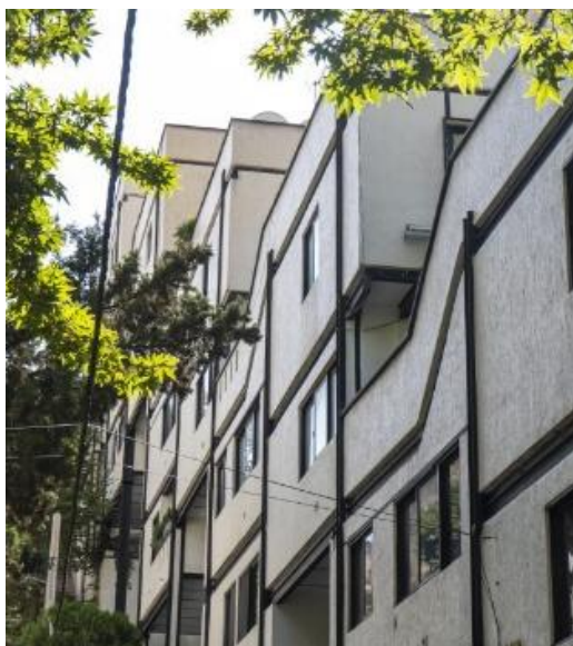
شکل ۱۱- مجتمع مسکونی آردیش

واحدهای مسکونی کمک می‌کند. در مقایسه با سایر ساختمان‌ها، این بنا کمترین میزان فضای تهی مستقل را دارد، زیرا طراحی آن بر مبنای تراکم و استفاده بهینه از زمین شکل گرفته است.