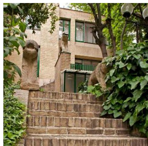
شکل ۷- خانه تناولی