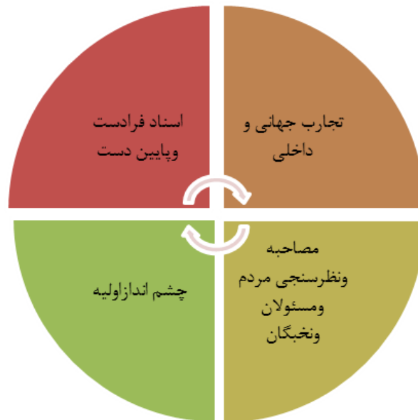
شکل ۳: چشم انداز شهر قزوین