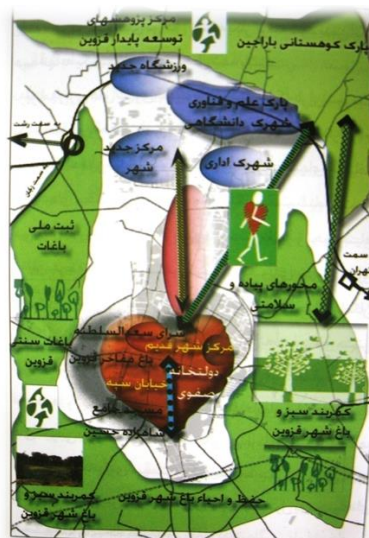
شکل ۶. راهبردهای شهر قزوین