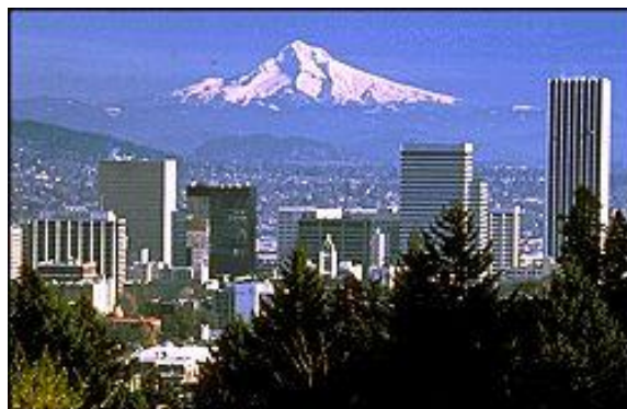
شکل ۱: بررسی روند شهرنشینی در دوران معاصر