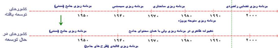
شکل ۲: برنامه CDS

این رهیافت از سال ۱۹۹۸ و با حمایت مستقیم بانک جهانی آغاز شد و سپس با همکاری نهادهای بین‌المللی دیگر نظیر UN, UNEP, ADB و Habitat و تشکیل اتحاد شهرها Cities Alliance در شهرها و کشورهای مختلف مورد استفاده قرار گرفت. پس از آن این رهیافت در بسیاری از شهرها و کشورهای جهان به ویژه کشورهای آسیایی و آفریقایی به آزمون در آمده است.