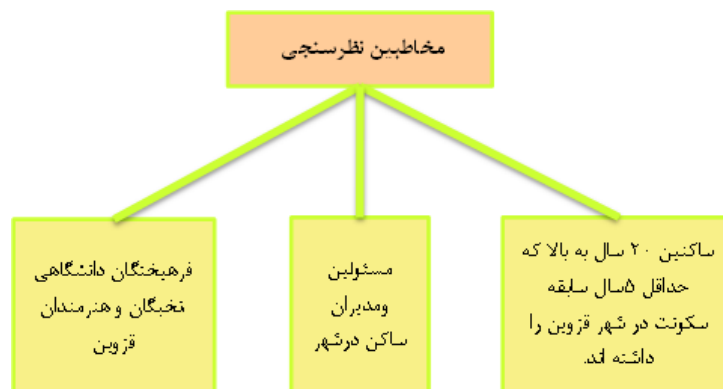
شکل ۴: مخاطبین نظرسنجی شهر قزوین